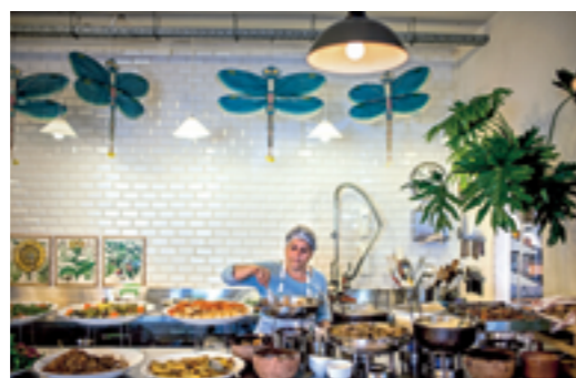
Restaurant Tawlet in Beiroet.