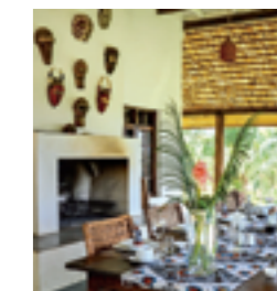
De Arusha-villa in Tanzania.