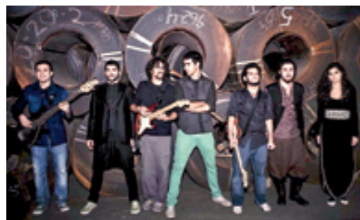
De alt-rockband Mashrou' Leila.