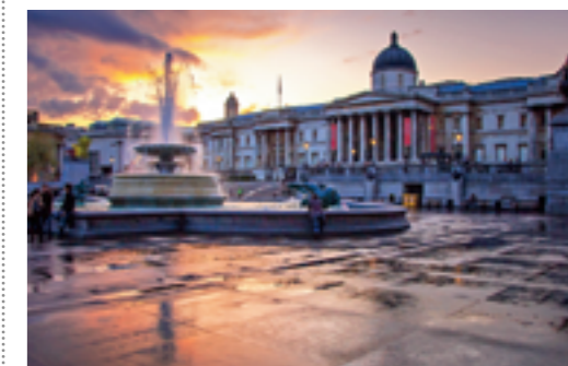
De National Portrait Gallery bij zonsondergang.

→ npg.org.uk , tinyurl.com/portrait-gallery-restaurant